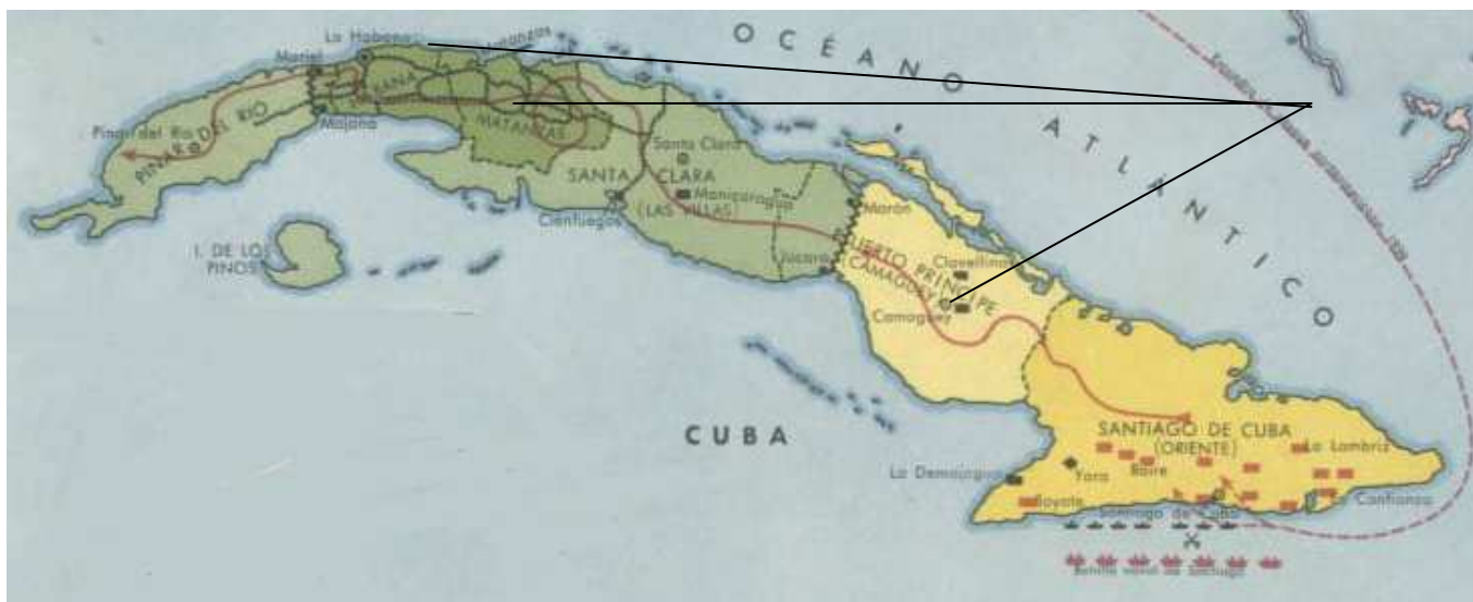
Ilustración 5. La Isla de Cuba y su reparto en provincias.

Los mozos que hemos visto estuvieron destinados al cuerpo de Infantería, en diferentes caz 57 .) situados en tres provincias cubanas: Matanzas, La Habana (ambas al norte de la isla) y Santiago de Cuba (situada al sur).