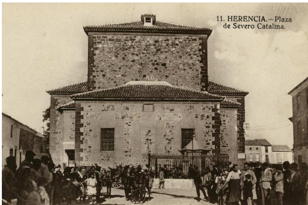
Imagen 1. Plaza de Severo Catalina.

Siguiendo con mi particular investigación sobre el origen de algunos de los nombres de las calles y enclaves herencianos, algunos ya olvidados, hoy presento este estudio sobre la denominada Plaza Severo Catalina que dio nombre a la plazuela donde se ubica el popular caño del agua a la espalda de la Iglesia Parroquial, y que hasta el último cuarto del siglo XIX era conocido como la Plazuela de la Fuente 1 .