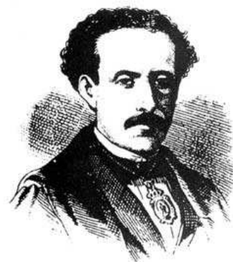
Imagen 2. Imagen de Severo Catalina 3 .

Su familia procedía del pueblo de Budia (Guadalajara) y se asentó en la capital conquense cuando el padre fue nombrado mayordomo o administrador de los bienes y rentas de la Catedral de Cuenca. Un hermano mayor de Severo, Gabino, estudió en el Seminario conquense de San Julián y fue nombrado párroco de Santo Domingo –también en Cuenca-, después director del Seminario, visitador del arciprestazgo de Uclés, Huete y Barajas de Melo y terminó siendo nombrado Obispo de Calahorra y Santo Domingo de la Calzada.