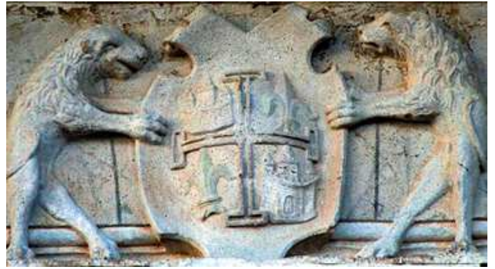
Casa de los Condes de las Cabezuelas, en la Plaza Mayor de Campo de Criptana, y detalle del escudo.