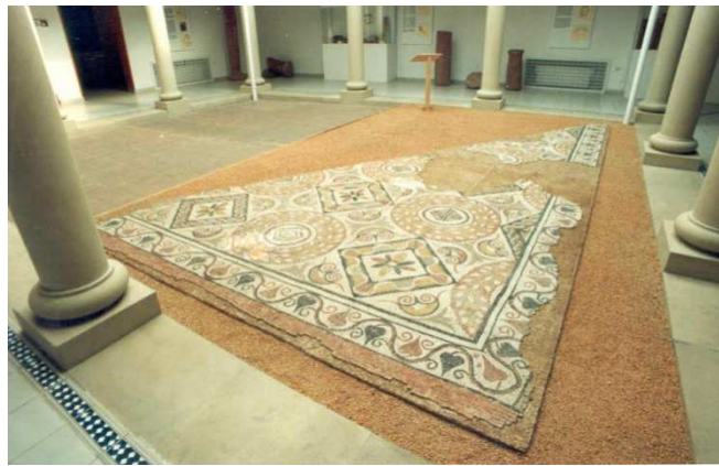
Mosaico romano encontrado en Alcázar de San Juan 10 .

Y así es como los romanos dominaron nuestra comarca. La historia es digna de un guión cinematográfico comparable a muchos de los que hemos visto en la gran pantalla. Hoy la memoria del rey Thurro está prácticamente olvidada aunque fue, sin duda, uno de los primeros en dejar patente el valor de los habitantes de nuestra comarca.