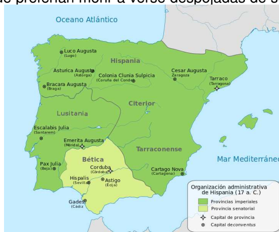
Mapa de la Península Ibérica bajo el dominio romano en el 17 a. C. 3

A partir del siglo II a.C., el ejército romano quiso dominar todo el interior de la Península Ibérica (nuestra zona constituida como provincia romana con el nombre de Tarraconense que posteriormente se dividiría en dos: la Cartaginense al sur y la Tarraconense al norte). Para ellos toda esta región era un país agreste e inhóspito, poblado de tribus salvajes y orgullosas, que preferían morir a verse despojadas de sus armas.