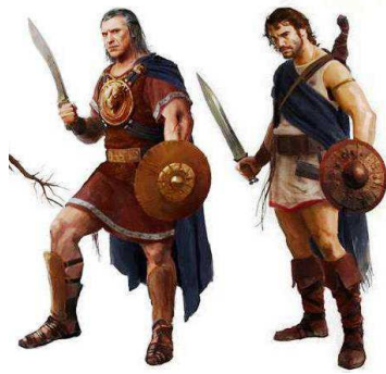
Soldados celtíberos 9 .

Y así es como los romanos dominaron nuestra comarca. La historia es digna de un guión cinematográfico comparable a muchos de los que hemos visto en la gran pantalla. Hoy la memoria del rey Thurro está prácticamente olvidada aunque fue, sin duda, uno de los primeros en dejar patente el valor de los habitantes de nuestra comarca.