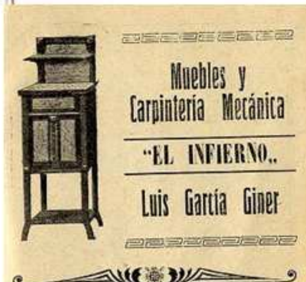
1915. Publicidad “El infierno”