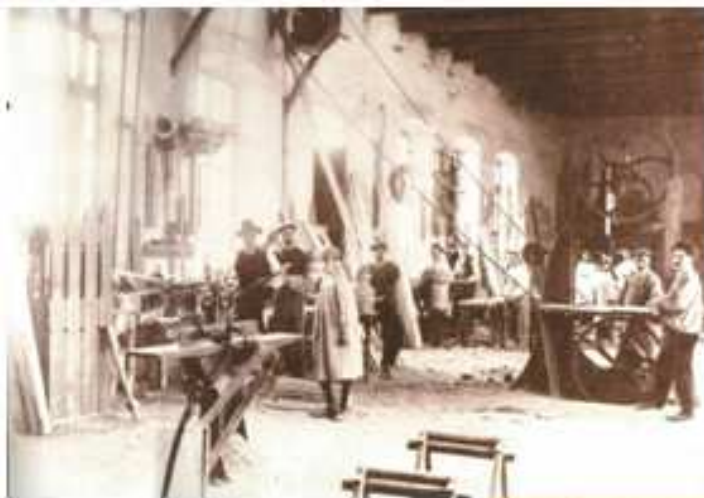
“El Infierno”. Año 1900

Pues “El Infierno” se llamará, dijo el viejo, riéndose de los temerosos... Y cuando hicieron la portada nueva, con letras de grandísima alzada se puso el nombre definitivo de aquella fábrica: El Infierno. Y a la calle se le llamó en adelante Callejón del Infierno... Durante años las beatas se persignaban al pasar ante la portada nueva y se dijo que cierta noche, una santa cofradía roció con agua bendita aquella puerta del Infierno”