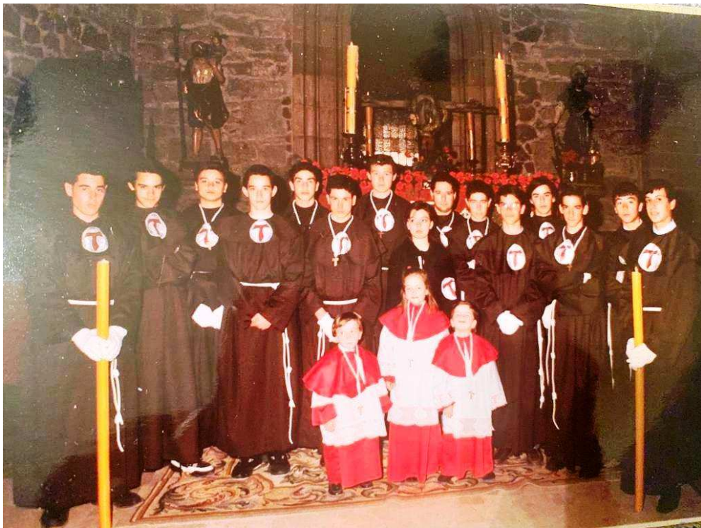
Primeros jóvenes costaleros de la Hermandad de los Estudiantes (1990)