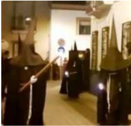
Austeridad y silencio al paso de la estación penitencial.