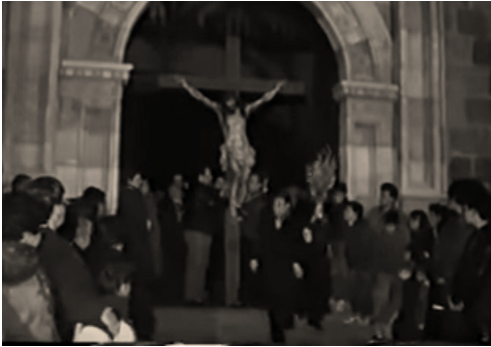
Vía Crucis del Martes Santo (1987), origen de la posterior formación de la Hermandad de los estudiantes.