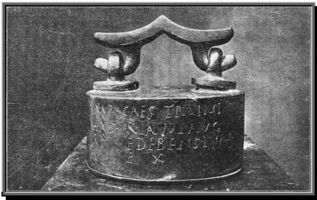
El Decempondio (depositado en el Museo de Ciudad Real)