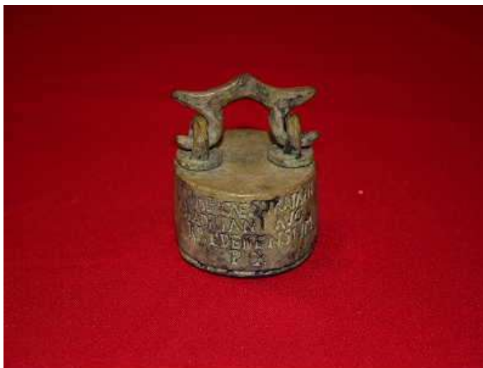
Ref. 850 Decempondio de Torrenueva (Ciudad Real) Dimensiones: 5,5 x 5,5 x 7 cm. Museo de Ciudad Real

Por otro lado, el Decempondio de Torrenueva se mostró en la Exposición que tuvo lugar en 1990 en el Palacio de Cristal del Parque del Retiro de Madrid bajo el título " BRONCES ROMANOS EN ESPAÑA "